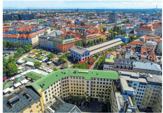
Oben: Rosental 7 – Dach der Hofseite mit Indach-Modulen (Abbildung: 1 Line architecture GmbH) Links: Sicht auf Rosental 7 vom Viktualienmarkt aus (Foto: BLfD, Birgit Neuhäuser)